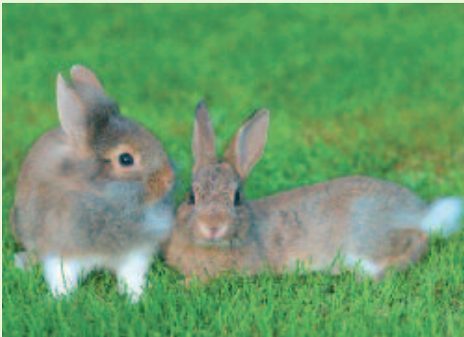
Kaniner er kvikke. Man kan godt se, at det her er to spilopmagere.

rigtig din opmærksomhed. Men de vil helst beskæftiges efter deres særlige behov som kaniner - så lader de gerne deres mennesker deltage i deres spændende liv og begejstrer med deres nysgerrighed - og I har et dream team.