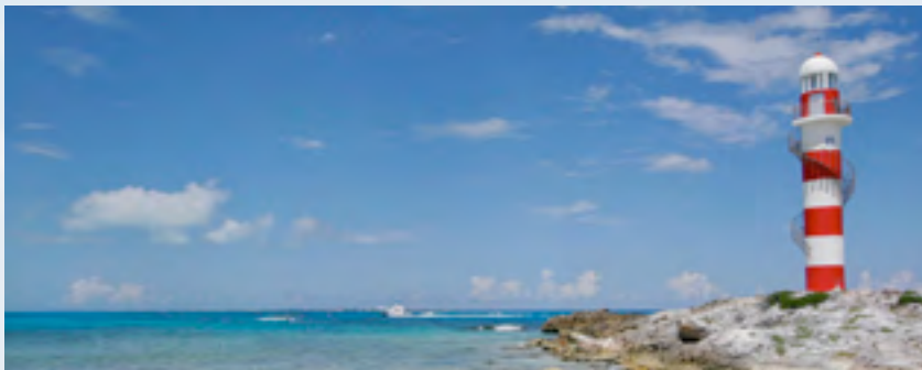
DET ØSTLIGSTE PUNKT AF YUCATAN - CANCUN - MEXICO