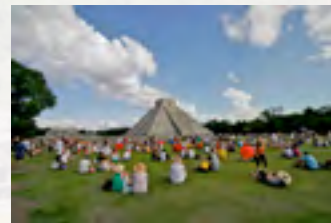
CHITZÉN ITZÁ PÅ YUCATAN VED VINTERSOLHVERV

I den situation ville det da være synd ikke at kunne tage den oplevelse med. Det interesserer mig, at erfare hvordan fremmede folkeslag lever og hvordan de har levet før i tiden. Der er så mange unikke steder rundt om i verden, der er et 'must see', hvis du nu alligevel er i nærheden.