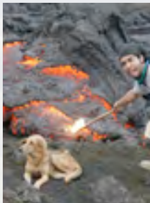
VULKANEN PACAYA I GUATEMALA

Værdien af de indsigter og erfaringer du får, gennem måneders rejser og oplevelser rundt om i verden er uvurderlige både for dig og for samfundet. De erfaringer du gør, og den modning og uddannelse du erhverver undervejs kan ikke fås på