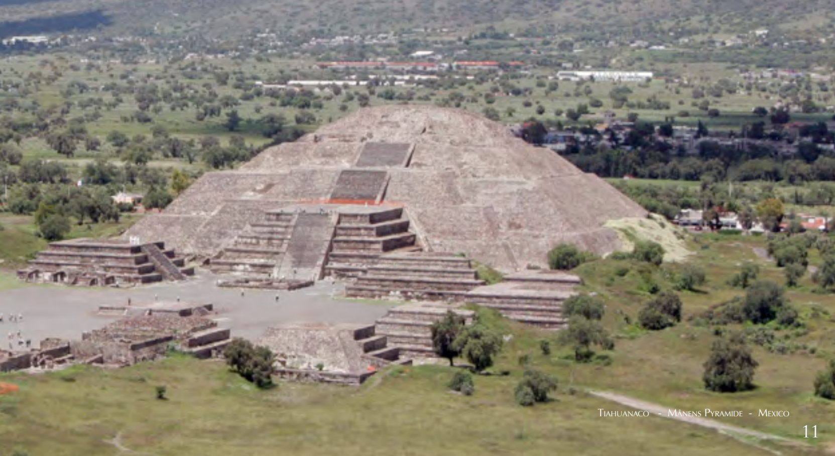
TIAHUANACO - MÄNENS PYRAMIDE - MEXICO