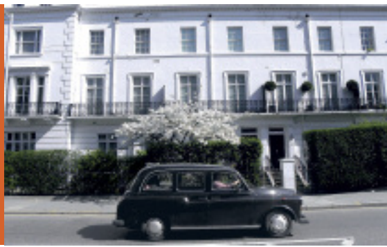
West End er den rige del af London.

område, der kaldes Docklands efter dokkerne. Her lagde skibe fra koloni-erne til kaj næsten hver dag før i tiden. I dag er store dele af Docklands domineret af moderne skyskrabere, virksomheder og boliger, og mange rige sports- og erhvervsfolk bor her, så om dagen kan du se de riges asiatiske au-pairpiger gå tur med børn i klapvogn.