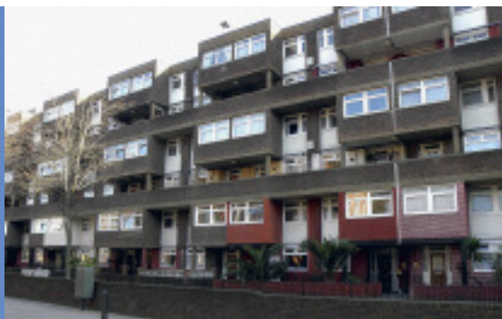
I East End bor langt de fleste i sociale boligbyggerier. De færreste ejer deres egne boliger.