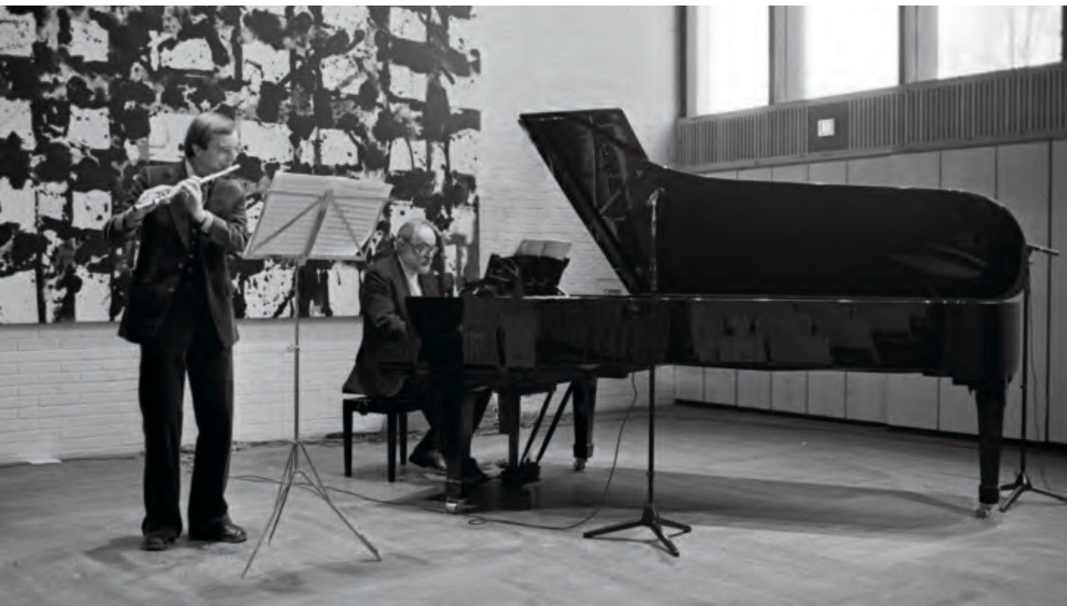
En 31-årig fløjtenist (1979), forfatteren til nærværende bog, opfører sammen med komponisten sonaten for fløjte og klaver Die Schildkröte (Skildpadden).

søger, ruller rundt, ikke vil fokusere, ikke vil fastholdes. Tilbage står den stærke, dominerende stemme, der i visse situationer ændrer sig totalt og bliver næsten hviskende og lidt læspende. Han ler sjældent med høj latter, men morer sig ofte stille eller med nogle hvislende t- og ts-lyde, den hurtige tankegang, de rappe svar. Men også det valne håndtryk, de slæbende skridt. ”Karakteren repræsenterer både antydningen og det hele. Karakteren har et stænk af karikatur i sig”, skriver Bentzon i sin bog om Beethoven, En skitse af et geni . 15