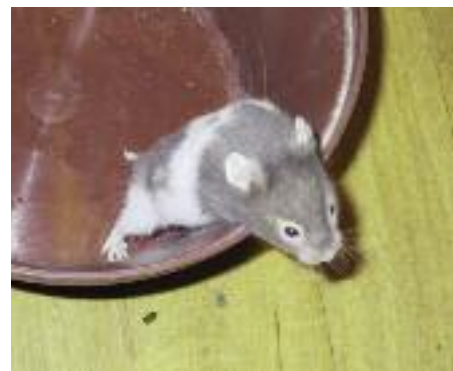
Hamstere kan være mestre i at stikke af.

Nogle hamsterier sætter faktisk først hamsterne til parring, når de har tilstrækkeligt med bestillinger. På den måde er de sikre på ikke at stå med en masse unger, som de ikke har plads til eller ikke kan komme af med. Hvis du vil tage til Sverige og hente din hamster, skal du først registreres som importør. Det er dog ikke så svært, du skal