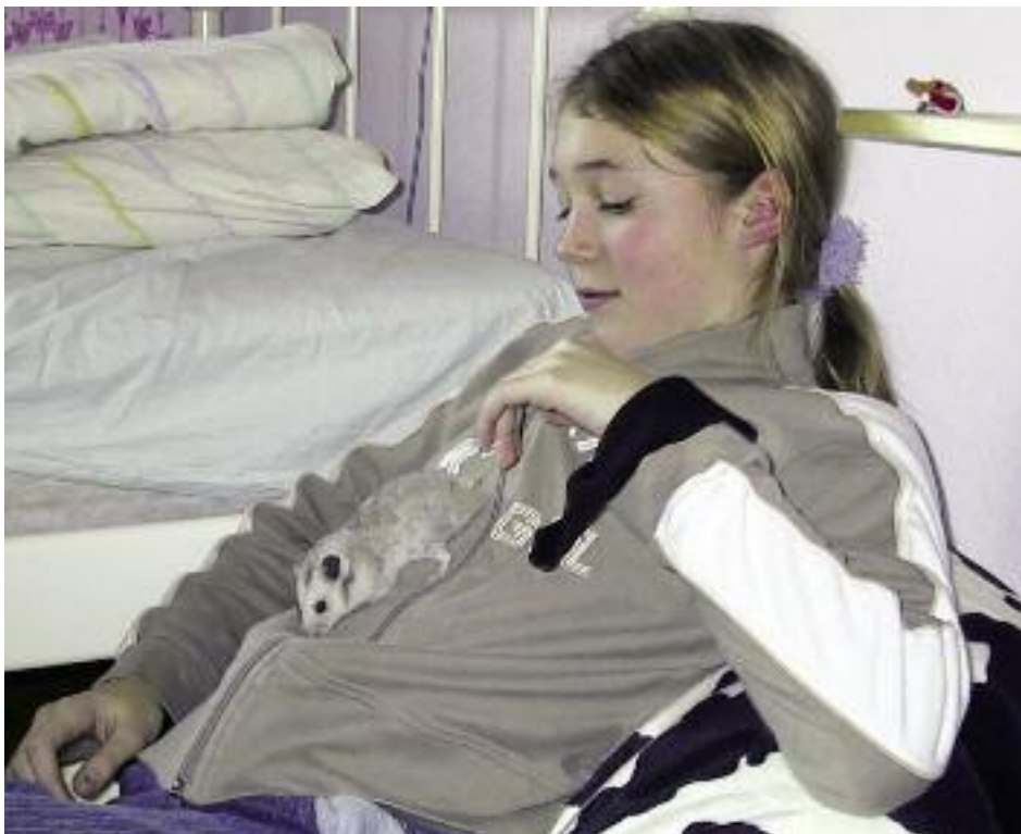
Hamstere kan give mange timers underholdning.