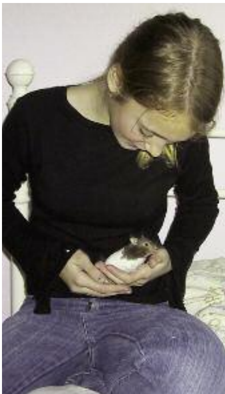
Hamstere bliver hurtigt tamme.