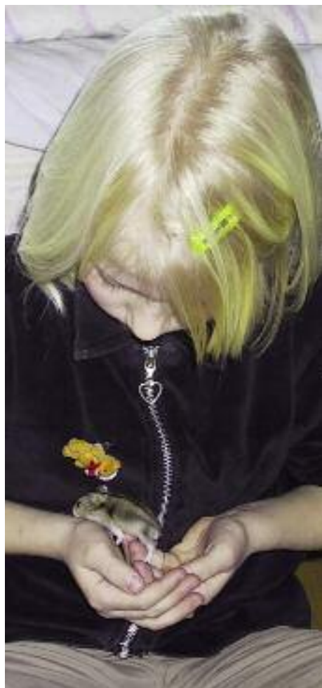
Dværghamstere er blevet meget populære de seneste år.

Hamsteren er et af de mest almindelige små kæledyr i de danske hjem. Og der er også mange positive ting at sige om den. Sød er den jo at se på, og dens størrelse gør den let at håndtere, også for børn. Hamsteren har ikke den lange ”ulækre” hale, som er en væsentlig grund til folks ubehag overfor rotter og mus. Den lugter ikke, og den er nem at passe. Og så koster det ikke nogen formue at anskaffe sig en hamster med alt tilbehør.