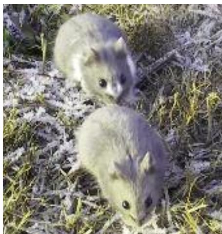
Skal man have flere hamstere sammen, så skal det være Dværghamstere!

blot skrive til Fødevarerstyrelsen (din lokale veterinærafdeling) og udfylde nogle papirer.