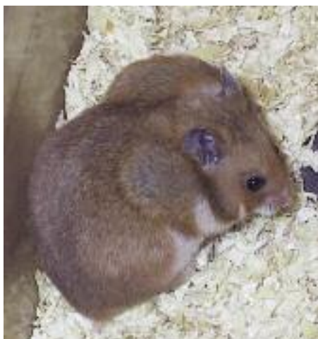
Her ser vi en Guldamster med foder i kindposeme.