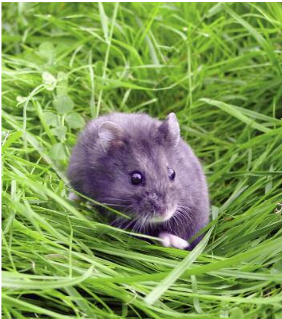
Sort Campbells Dværghamster.

Hvor mange hamstere du skal købe, afhænger lidt af hvilken art, du køber. Er det Dværghamstere, egner de sig fint til at holde i par, og det går som regel bedst, hvis det er to dyr, der kender hinanden i forvejen.