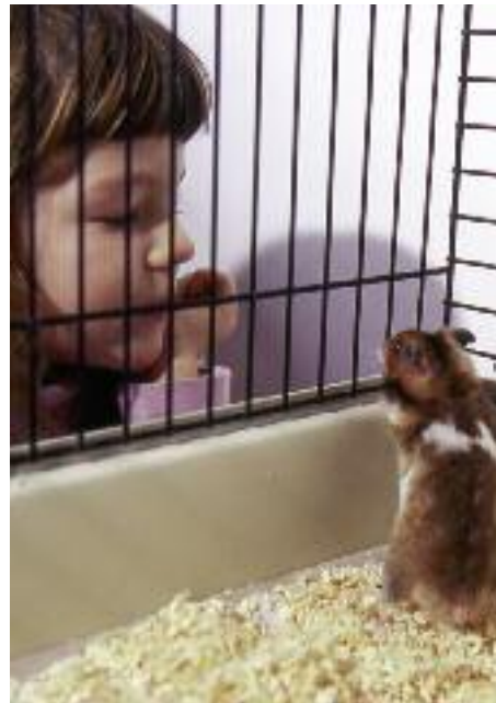
Tal roligt til din hamster.