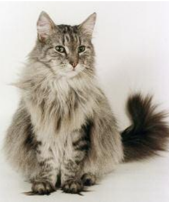
En af de første skovkatte i Danmark med flotte lange snesko.