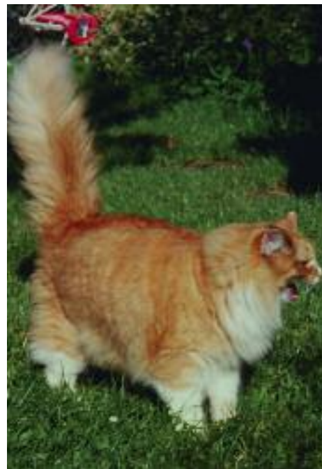
En flot rød skovkat

selvtillid overlevede, mens de andre bukkede under af sult. I 1800-tallet stak skovkatten til søs. Skibene der bl.a. sejlede til Amerika, var meget hårdt plaget af rotter. Kaptajnerne blev derfor pålagt at sørge for, at der altid var flere effektive skibskatte om bord. Disse katte skulle være så store, stærke og modige som overhovedet muligt. Derfor blev skovkatten en meget eftertragtet skibskat. Især de røde, mente man, var meget aggressive og derfor gode til at bekæmpe de mindst lige så aggressive rotter. Når skibene nåede USA rømmede nogle af søfolkene, og det samme gjorde en del af skibskattene. Derfor mener nogle, at det er rømmede Norske Skovkatte, der har været med til at skabe Maine Coon katten i Amerika. Det kan også være derfor, at Maine Coonen ind imellem omtales som den Amerikanske Skovkat. Der er dog helt klart tale om to forskellige racer, og Maine Coonen kan du finde beskrevet i en anden bog i denne serie om racekatte.