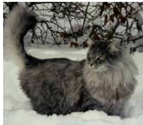
Skovkattens vinterpels giver god beskyttelse mod kulde og sne.

Naturens hårde udvælgelse har været med til at give den Norske Skovkat sine karakteristika. Skovkatten har nemlig fået høje tykke ben, så den kan færdes i et sne-dækket landskab, lange hår mellem tærerne (kaldet snesko) så den undgår at sneen klumper sammen mellem tærerne og at få forfrysninger i trædepuderne. En kraftig vandskyende pels på kroppen, som giver perfekt beskyttelse mod kulde og regn er også vigtig for en naturkat. Endelig har den fået den lange buskede hale der, når katten ruller sig sammen for at sove, holdes tæt til kroppen og ansigtet, og dermed giver katten mulighed for at holde varmen selv i et meget koldt klima.