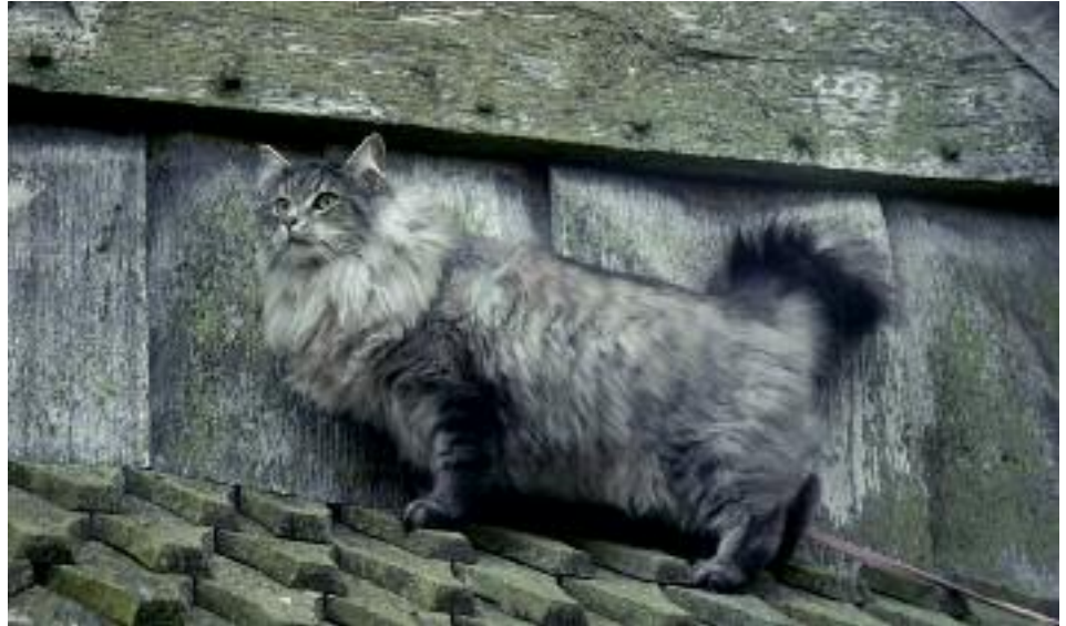
En stor robust hankat er klatret til tops på taget af et vikingehus.

Den Norske Skovkat er en af de største katteracer. Ud over at være en stor kat, er det samtidig en meget robust og muskuløs kat. Denne robusthed og disse muskler er skovkatten helt overbevist om, at den har fået, fordi de skal bruges til noget. Derfor vil katten blive meget glad for et kradsetræ eller klatremiljø, så den har mulighed for at løbe, springe, lege og ikke mindst klatre. Ligesom alle andre pelsklædte dyr, fælder skovkatten også, men med en ugentlig soignering kan du undgå en del løse kattehår i møblerne. Skovkattens størrelse gør at den kan virke lidt klodset og ikke så elegant som de orientalske racer.