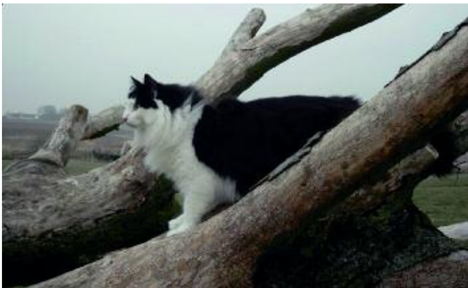
Skovkatten er skabt af naturen til at kunne klare sig i et koldt klima.

Højt oppe i de norske fjelde blæser der en kold vind, som går gennem marv og ben. Støvregnen gør samtidig alting vådt, koldt og klamt. Bag et stort fjeldstykke, der giver en lille smule læ for den kolde regn, ligger en stor sammenrullet pelsklump. Støvregnen samler sig efterhånden til dråber på den vandskyende pels, og når dråberne bliver store nok, løber regnen roligt hen over pelsen og forsvinder ned i det fugtige underlag. Klumpen rejser sig, og det viser sig at være en stor flot Norsk Skovkattehan. Han strækker benene, krummer ryggen og skutter sig lidt i det kolde og våde vejr. Maven knurrer allerede, men foran ham ligger nogle timers koncentreret jagt, inden den værste sult er stillet. Måske er han heldig at få klørerne i en mus eller et uopmærksomt eger, ellers må han til elven og forsøge at fange en laks i det kolde vand.