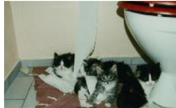
Skovkatten er god til at finde på sjove lege – syntes den selv.

gang du sætter dig i sofaen, men behøver den en lille lur er det et godt sted at ligge. Hvis du har set to katte ligge mageligt med et veltilfreds smil på læben, pote i pote, eller set to katte tumle glade rundt på gulvet, vil du ikke være i tvivl om, hvor meget glæde katte kan have af hinanden. Specielt unge katte men også en del ældre katte har meget stor glæde af en artsfælle, som de kan lege med, og i det hele taget dele tilværelsen med.