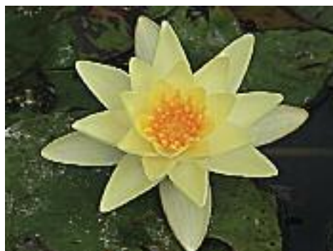
Nymphaea Madame Wilfron Gonnère, Nymphaea "Red Spider", Nymphaea marliacea chromatella.