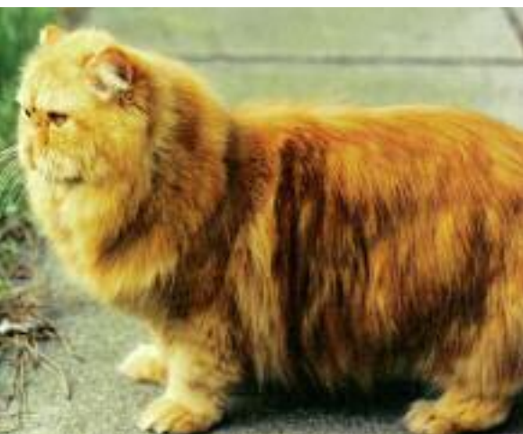
En flot rød perserhan.

Englænderne importerede langhårede katte fra Tyrkiet og startede målrettet opdræt af disse katte fra Ankara – deraf navnet angorakatte. De langhårede katte hed angorakatte helt indtil 1965, hvor navnet