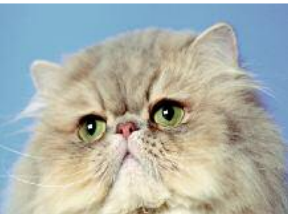
Perseren er verdens mest udbredte racekat.

Perseren er en meget gammel race, hvis historie menes at gå mange hundrede år tilbage. Perseren er særdeles populær og regnes for verdens mest udbredte racekat. Den kendes på dens lange pels og kraftige, kompakte krop og ikke mindst på dens meget hengivne, rolige og velafbalancerede temperament.