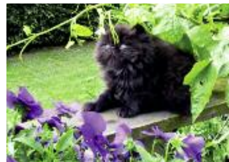
Perseren kendes blandt andet på den lange pels.

Men perserkatten har eksisteret endnu tidligere. Hieroglyffer viser så tidligt som 1684 f. vt. billeder af langhårede katte. Disse