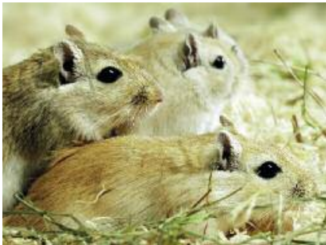
I naturens omgivelser lever ørkenrotter i grupper.

► Centralasiens halvørkner og stepper er de mongolske ørkenrotters hjemsted. Her lever de i grupper med en kompleks social struktur og en streng rangfølge. Familien bor i forgrenede gangsystemer med flere kamre, som ligger mere end 150 cm dybt under jorden og kan brede sig over mere end fem meter. Ud over hovedboet findes der ofte flere boer i de nærmeste omgivelser. I deres underjordiske husly oplagrer dyrene føde og finder beskyttelse mod vind og vejr og deres talrige fjender.