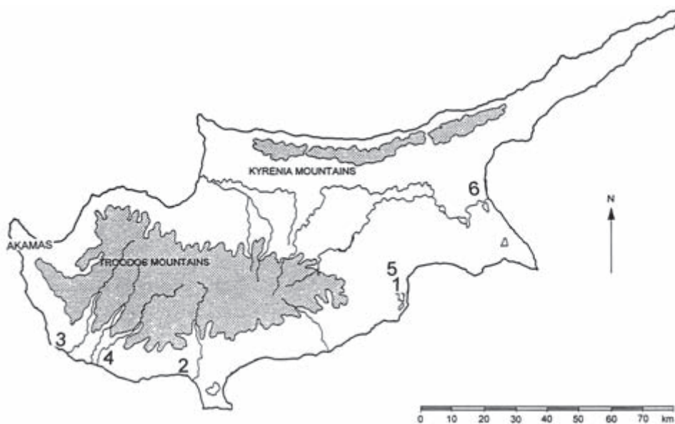
FIG. 1 Kort over Cypern med angivelse af de lokaliteter, der er nævnt i artiklen. 1: Kition; 2: Kourion; 3: Pafos; 4: Palaipafos; 5: Panayia Ematousa; 6: Salamis.