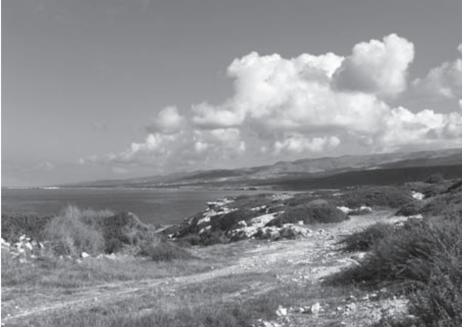
FIG. 3 Akamas-halvøen.

påviste, at det forholdt sig anderledes i oldtiden, nærmere betegnet mellem 300 f.Kr. og 700 e.Kr. I disse århundreder udgjorde Cypern én samlet politisk enhed, der i begyndelsen var underlagt de ptolemæiske konger i Ægypten. De gjorde Pafos, 30-40 km syd for Akamas, til øens hovedstad, og byen beholdt denne position, da Cypern i år 58 f.Kr. blev indlemmet i Romerriget. 2 I slutningen af 3. eller i 4 årh. e.Kr. flyttedes hovedstaden til Salamis på østkysten. 3 Kristendommen fik relativt hurtigt tag i befolkningen, og i senantikken oplevede Cypern en ny blomstringstid, som arabernes systematiske udplyndringer af kystbyerne i 7. årh. e.Kr. satte en stopper for. 4