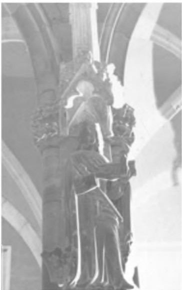
Dagobert II – den sidste regerende Merovingerkonge.

således i hans årer to slags blod - en frankisk herskers blod og et mystisk havuhyres blod.