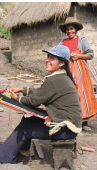
Der er stadig unge piger, der viderefører de gamle vævetraditioner.