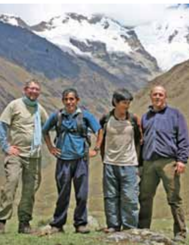
På vores rejser arbejder vi tæt sammen med peruanske venner.