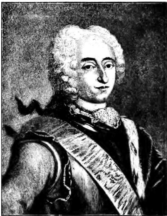
FREDERIK DEN FJERDE