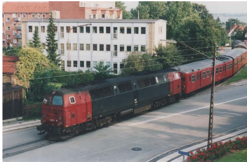
Havnesporet blev til sidst kun anvendt til kørsel med udrangerede S-tog der bliver skrottet hos Jan's Transport og Produkthandel ved Holbæk havn. Foto: ASN 2002